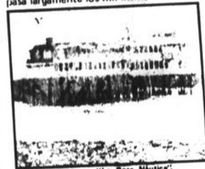
Restaurante "La Rosa Náutica".

Los que aún tienen la increíble suerte de contar con un trabajo, sobre viven en la mayor explotación, con un sueldo de hambre, cuyo mínimo vital ha sido fijado en 700 intis mensuales;