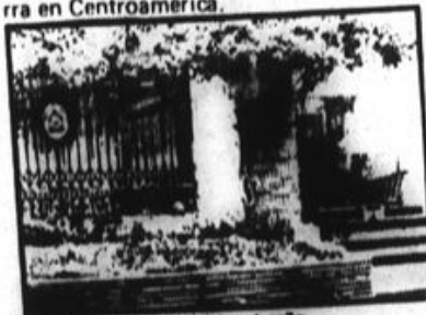
Embajada del gobierno hondureño.

Esta acción expresa el repudio de nuestro pueblo contra este régimen que se ha convertido en el fiel aliado de la administración Reagan que busca frustrar el proceso revolucionario de Nicaragua, y pugna por desencadenar la guerra en Centroamérica.